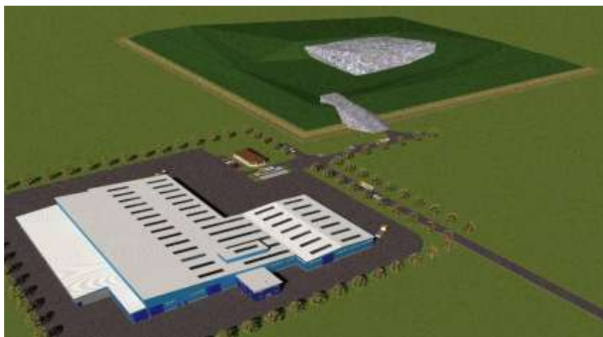
1. ábra A Királyszentistváni Regionális Hulladékkezelő Telep látványterve

A tervezési területen belül, a közszolgáltató mellett további vállalkozások is tevékenykednek a települési szilárdhulladék-gazdálkodás területén (a velük kapcsolatos fontosabb információkat a 7-8. táblázatok összegzik; forrás: http://okir.kvvm.hu/kezelo ).